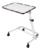
Table de lit blanche Diffusion

Table de lit "Easy" (livrée en kit) avec plateau inclinable par rotation et réglable latéralement. Hauteur du plateau 70cm à 105cm. Modèle avec plateau blanc. Réf. 421000. Modèle avec plateau hêtre. Réf. 421014.