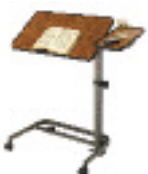
Table de lit ronce de noyer Diffusion

Table de lit "Diffusion" à piètement inclinable (40x60 cm) de couleur blanche. Réf. 421400.