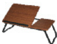
Table de lit multi-usage