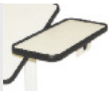
Table de lit "Diffusion" à piètement inclinable (40x60 cm) façon ronce noyer. Réf. 421414.