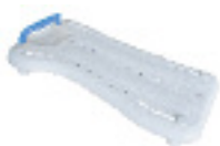
Planche de bain